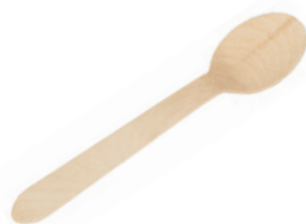
GW2405 CUCCHIAIO LEGNO dimensioni size 16 cm pz/conf pcs/pack 100 pz/cart pcs/box 2000