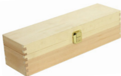
502350 CASSETTA CHIUSA 1 BOTTIGLIA PINO NATURALE dimensioni size 36x11 h10 cm pz/cart pcs/box 20