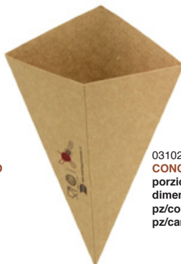
0310282 CONO ALIMENTI AVANA MEDIO porzioni portions 1 e ½ dimensioni size 145h285 mm pz/conf pcs/pack 100 pz/cart pcs/box 1000