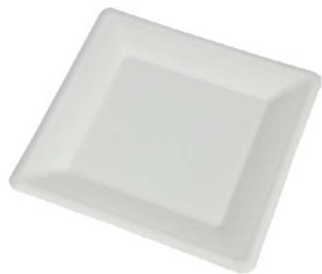
YDP031 PIATTO QUADRO BIO-ECO dimensioni size 26x26 cm pz/conf pcs/pack 25 pz/cart pcs/box 500