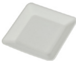
YDP036 PIATTO QUADRO BIO-ECO dimensioni size 16x16 cm pz/conf pcs/pack 50 pz/cart pcs/box 1000