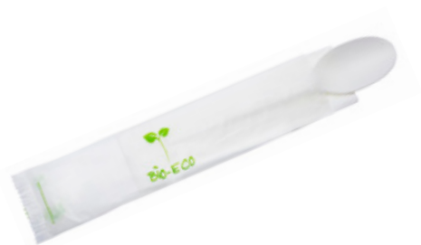
1VP213 CUCCHIAIO C-PLA 5 gr + TOVAGLIOLO SPOON + NAPKIN pz/cart pcs/box 500