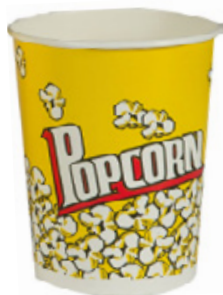
1BG060 CONTENITORE POP CORN SMALL capacità capacity 32oz / 950ml pz/conf pcs/pack 50 pz/cart pcs/box 500