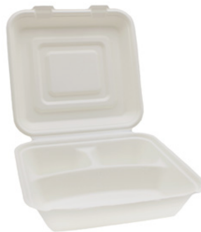
YDB032 CONTENITORE+COPERCHIO BIO-ECO TRISCOMPARTI dimensioni size 238x234 h55/76 mm capacità capacity 1000 ml pz/conf pcs/pack 50 pz/cart pcs/box 250