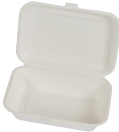
YDB030 CONTENITORE+COPERCHIO BIO-ECO dimensioni size 251x162 h50/63 mm capacità capacity 750 ml pz/conf pcs/pack 50 pz/cart pcs/box 500