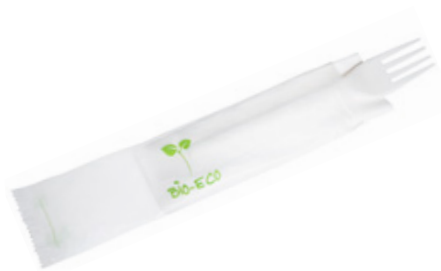
1VP215 FORCHETTA C-PLA 5 gr + TOVAGLIOLO FORK + NAPKIN pz/cart pcs/box 500