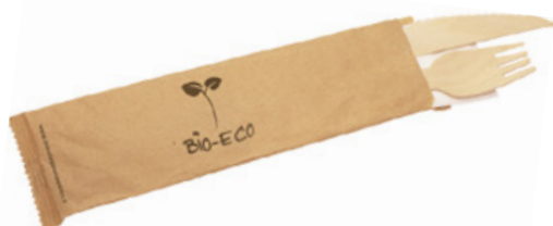
GW2453D BIS LEGNO + TOVAGLILO (forchette/coltello/tovagliolo 2 veli) (fork/knife/napkin 2 layers) pz/conf pcs/pack 50 pz/cart pcs/box 250