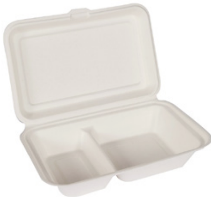
YDB040 CONTENITORE+COPERCHIO BIO-ECO BISCOMPARTI dimensioni size 240x160 h50 mm capacità capacity 650 ml pz/conf pcs/pack 50 pz/cart pcs/box 250