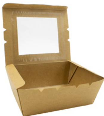
0310265 BOX ALIM. MEDIO CON FINESTRA - CERALACCA dimensioni size 175x140h65 mm pz/conf pcs/pack 50 pz/cart pcs/box 200