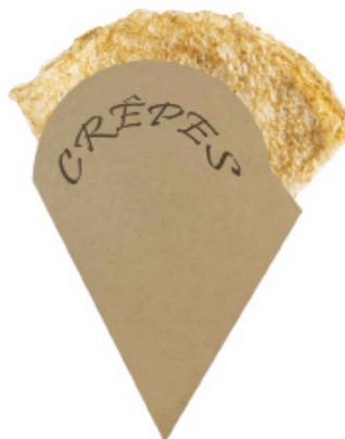
0310228 PORTA CRÊPES 1/8 CARTA pz/conf pcs/pack 250 pz/cart pcs/box 500