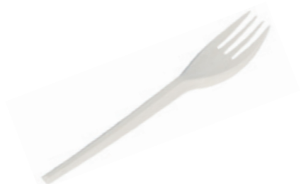
1VP320 FORCHETTA C-PLA 4 gr dimensioni size 16,5 cm pz/conf pcs/pack 50 pz/cart pcs/box 1000

*utilizzato come riferimento la forchetta.