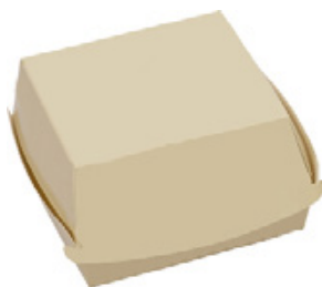
0310202 BOX PANINO MEDIO dimensioni size 120x120h70 mm pz/conf pcs/pack 100 pz/cart pcs/box 600