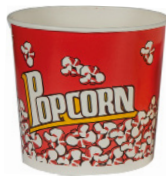
1BG063 CONTENITORE POP CORN EXTRA-LARGE capacità capacity 85oz / 2500ml pz/conf pcs/pack 50 pz/cart pcs/box 300