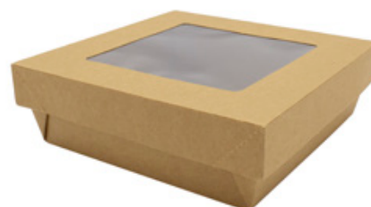
0310288 BOX ALIM. GRANDE CONT.+COPERCHIO FINESTRA - CERALACCA dimensioni sup. size 195x195h52 mm pz/conf pcs/pack 30 pz/cart pcs/box 180