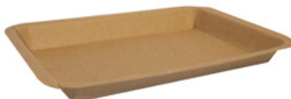
MT5 VASSOIO CA+PE AVANA KRAFT 230 ml dimensioni size 170x122h16mm pz/conf pcs/pack 100 pz/cart pcs/box 1200