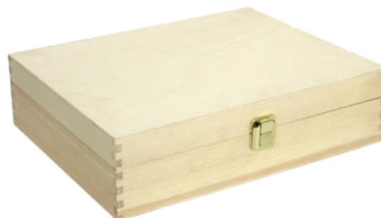
502354 CASSETTA CHIUSA 3 BOTTIGLIE PINO NATURALE dimensioni size 35x27 h9 cm pz/cart pcs/box 12