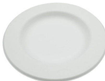
YFYF10 PIATTO STYLE BIO-ECO BORDO LARGO diametro diameter 26 cm pz/conf pcs/pack 50 pz/cart pcs/box 500