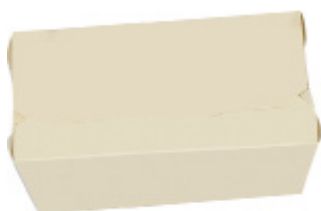
0310214 BOX ALIMENTI PICCOLO dimensioni size 160x110h50 mm pz/conf pcs/pack 80 pz/cart pcs/box 480