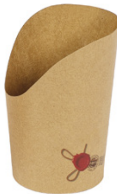
0310262 COPPA P/PATATINE AVANA GRANDE dimensioni size Ø70 h78/130 mm pz/conf pcs/pack 50 pz/cart pcs/box 1000