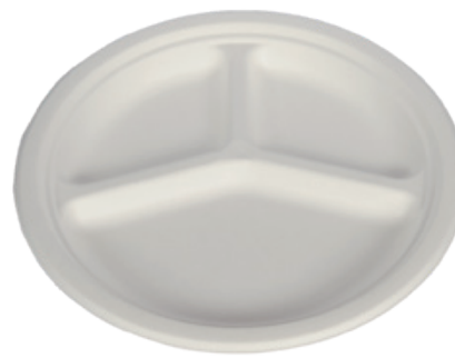
YDP007 PIATTO TRIS BIO-ECO diametro diameter 26 cm pz/conf pcs/pack 25 pz/cart pcs/box 800