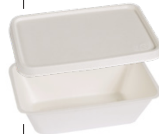
YDT011 COPERCHIO / LID BIO-ECO PER VASCHEFFA YDT012 pz/conf pcs/pack 50 pz/cart pcs/box 900