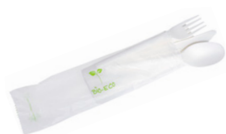
1VP219 TRIS C-PLA 5 gr cad. + TOVAGLIOLO (forchetta/coltello/cucchiaio/tovagliolo) (fork/knife/spoon/napkin) pz/cart pcs/box 250