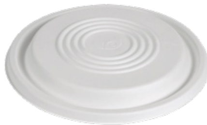
YDL086 COPERCHIO / LID CIOTOLONE BIO-ECO diametro diameter 21 cm pz/conf pcs/pack 50 pz/cart pcs/box 400