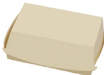
0310204 BOX PANINO RETTANGOLARE dimensioni size 150x100h70 mm pz/conf pcs/pack 100 pz/cart pcs/box 600