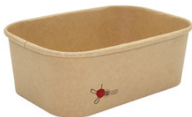
1BG182 PAPER BOWL R900 CERALACCA capacità capacity 900 ml dimensioni size 168x120h65 mm pz/conf pcs/pack 50 pz/cart pcs/box 300