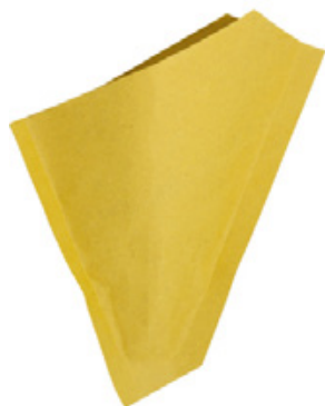
2TV098 CONO CARTA GIALLA PICCOLO dimensioni size h155X185 mm pz/conf pcs/pack 500 pz/cart pcs/box 7500