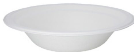
YDL044 PIATTO SCODELLA BIO-ECO diametro diameter 18 cm capacità capacity 400 cc pz/conf pcs/pack 50 pz/cart pcs/box 1000