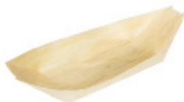
GW3016 BARCETTA PALMA dimensioni size 145x87 mm pz/conf pcs/pack 50 pz/cart pcs/box 1000