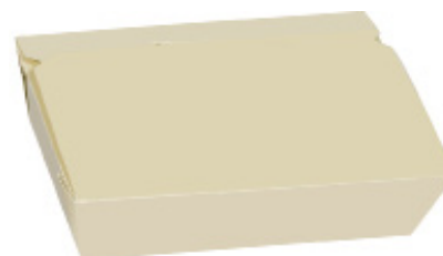
0310218 BOX ALIMENTI GRANDE dimensioni size 200x140h50 mm pz/conf pcs/pack 60 pz/cart pcs/box 240