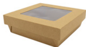
0310286 BOX ALIM. PICCOLO CONT.+COPERCHIO FINESTRA - CERALACCA dimensioni sup. size 143x143h50 mm pz/conf pcs/pack 30 pz/cart pcs/box 240