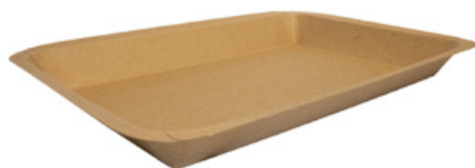
MT1 VASSOIO CA+PE AVANA KRAFT 680 ml dimensioni size 248x174h22 mm pz/conf pcs/pack 100 pz/cart pcs/box 600