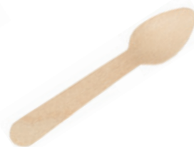
GW2407 CUCCHIAINO LEGNO dimensioni size 11 cm pz/conf pcs/pack 100 pz/cart pcs/box 5000