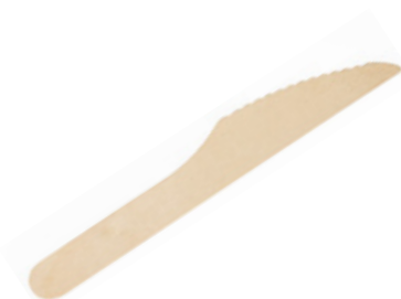
GW2406 COLTELLO LEGNO dimensioni size 16,5 cm pz/conf pcs/pack 100 pz/cart pcs/box 2000