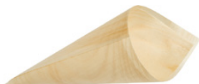
GW3030 CONO PALMA dimensioni size 180x130 mm pz/conf pcs/pack 50 pz/cart pcs/box 1000