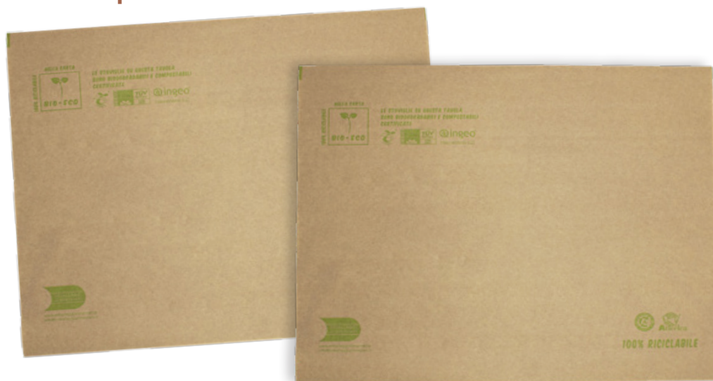
2VR116 TOVAGLIETTA ECOLOGICA CARTA AVANA 70 gr dimensioni size 33x44 cm pz/conf pcs/pack 500 pz/cart pcs/box 1500