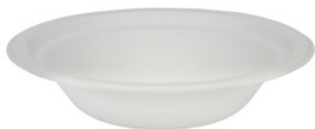
YDL006 PIATTO FONDO BIO-ECO diametro diameter 19 cm capacità capacity 680 cc pz/conf pcs/pack 25 pz/cart pcs/box 1200