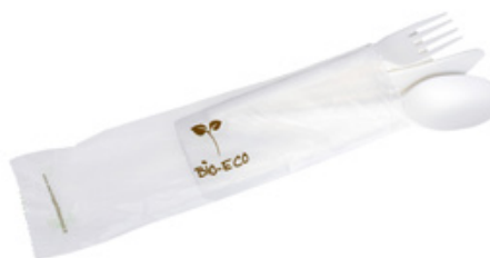
1VP319 TRIS C-PLA 4 gr cad. + TOVAGLIOLO (forchetta/coltello/tovagliolo) (fork/knife/napkin) pz/conf pcs/pack 50 pz/cart pcs/box 250