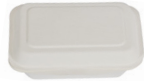
YDB004 CONTENITORE+COPERCHIO BIO-ECO dimensioni size 172x113 h37/52 mm capacità capacity 350 ml pz/conf pcs/pack 50 pz/cart pcs/box 1000