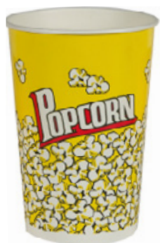
1BG061 CONTENITORE POP CORN MEDIUM capacità capacity 46oz / 1360ml pz/conf pcs/pack 50 pz/cart pcs/box 500