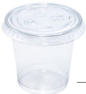
1VP250 COPERCHIO TRASP. PIANO PET dimensioni size Ø45 mm pz/conf pcs/pack 100 pz/cart pcs/box 2500