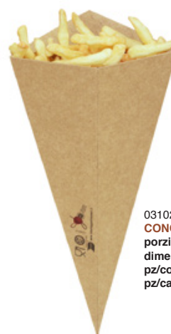
0310284 CONO ALIMENTI AVANA GRANDE porzioni portions 2 dimensioni size 160h310 mm pz/conf pcs/pack 100 pz/cart pcs/box 1000