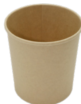
1BG699 SOUP BUCKET AVANA SCB1000 capacità capacity 1000 ml / 32 oz pz/conf pcs/pack 25 pz/cart pcs/box 500