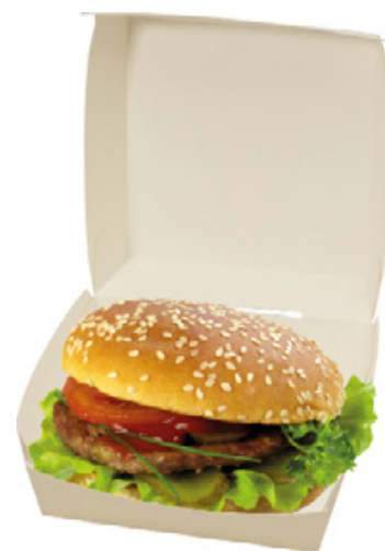
0310205 BOX PANINO MAXI dimensioni size 160x155h90 mm pz/conf pcs/pack 50 pz/cart pcs/box 300