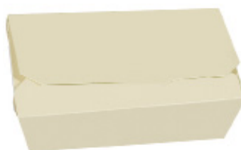
0310216 BOX ALIMENTI MEDIO dimensioni size 180x120h50 mm pz/conf pcs/pack 60 pz/cart pcs/box 360