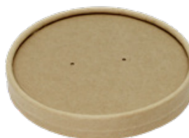
1BG701 COPERCHIO AVANA per Soup bucket SCB750/1000 pz/conf pcs/pack 25 pz/cart pcs/box 500