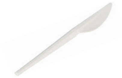
1VP224 COLTELLO C-PLA 4,5 gr dimensioni size 16,5 cm pz/conf pcs/pack 50 pz/cart pcs/box 1000