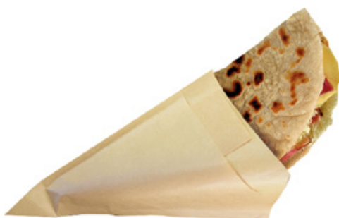
2TV094 CONO AVANA P/PANINO + TOVAGLILO pz/conf pcs/pack 200 pz/cart pcs/box 1800