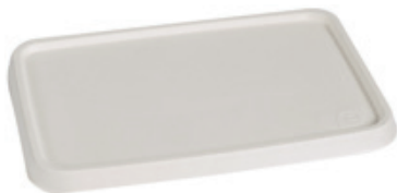
YDB062 COPERCHIO / LID BIO-ECO PER VASCHEFFE YDB063-YDB064 pz/conf pcs/pack 50 pz/cart pcs/box 600