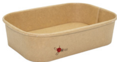
1BG180 PAPER BOWL R600 CERALACCA capacità capacity 600 ml dimensioni size 168x120h45 mm pz/conf pcs/pack 50 pz/cart pcs/box 300