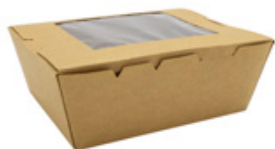
0310263 BOX ALIM. PICCOLO CON FINESTRA - CERALACCA dimensioni size 130x110h65 mm pz/conf pcs/pack 50 pz/cart pcs/box 200