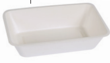
YDB063 VASCHEFFA BIO-ECO dimensioni size 203x136 h50 mm capacità capacity 1000 cc pz/conf pcs/pack 50 pz/cart pcs/box 600