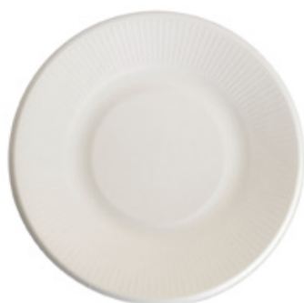
YDP003 PIATTO BIO-ECO diametro diameter 21 cm pz/conf pcs/pack 50 pz/cart pcs/box 500