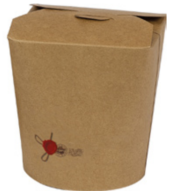
1BG084 TAKE AWAY BOX AVANA 1000cc capacità capacity 1000 cc pz/conf pcs/pack 50 pz/cart pcs/box 500