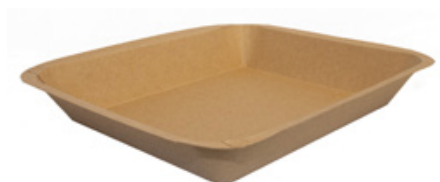
MT4 VASSOIO CA+PE AVANA KRAFT 400 ml dimensioni size 170x148h24mm pz/conf pcs/pack 50 pz/cart pcs/box 600