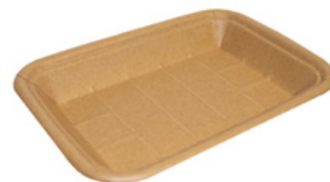
MT6 VASSOIO CA+PE AVANA KRAFT 430 ml dimensioni size 205x141h24mm pz/conf pcs/pack 100 pz/cart pcs/box 600