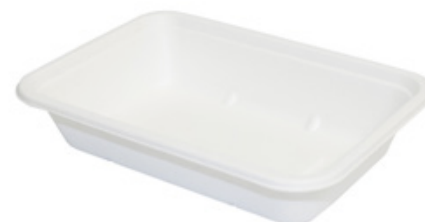
YDT001 VASCHEFFA BIO-ECO dimensioni size 170x120 h40 mm capacità capacity 500 ml pz/conf pcs/pack 25 pz/cart pcs/box 1000