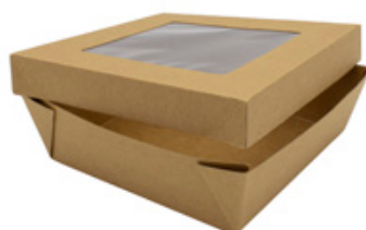
0310287 BOX ALIM. MEDIO CONT.+COPERCHIO FINESTRA - CERALACCA dimensioni sup. size 163x163h51 mm pz/conf pcs/pack 30 pz/cart pcs/box 240