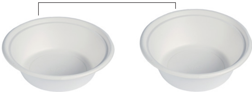
YDL084 CIOTOLONE BIO-ECO diametro diameter 21 cm capacità capacity 900 cc pz/conf pcs/pack 50 pz/cart pcs/box 400