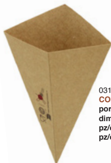
0310280 CONO ALIMENTI AVANA PICCOLO porzioni portions 1 dimensioni size 145h210 mm pz/conf pcs/pack 100 pz/cart pcs/box 1000