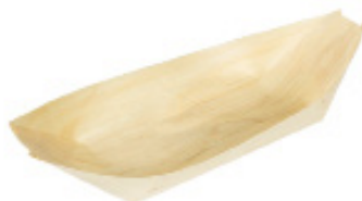
GW3017 BARCETTA PALMA dimensioni size 170x97 mm pz/conf pcs/pack 50 pz/cart pcs/box 1000