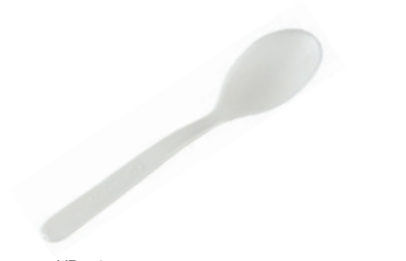
1VP226 CUCCHIAINO C-PLA dimensioni size 10,5 cm pz/conf pcs/pack 100 pz/cart pcs/box 2000