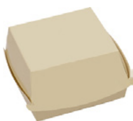
0310200 BOX PANINO PICCOLO dimensioni size 100x100h70 mm pz/conf pcs/pack 100 pz/cart pcs/box 600