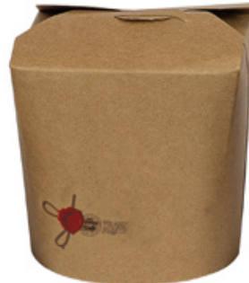
1BG082 TAKE AWAY BOX AVANA 750cc capacità capacity 750 cc pz/conf pcs/pack 50 pz/cart pcs/box 500