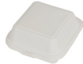
YDB003 CONTENITORE+COPERCHIO BIO-ECO dimensioni size 153x147 h48/78 mm capacità capacity 350 ml pz/conf pcs/pack 25 pz/cart pcs/box 500