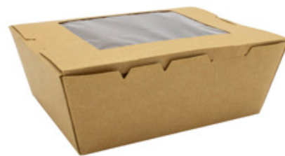
0310275 BOX ALIM. GRANDE CON FINESTRA - CERALACCA dimensioni size 215x160h65 mm pz/conf pcs/pack 50 pz/cart pcs/box 200