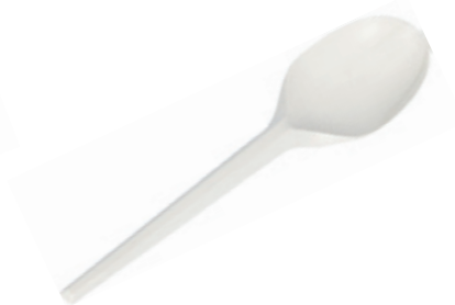
1VP222 CUCCHIAIO C-PLA 5,6 gr dimensioni size 16,5 cm pz/conf pcs/pack 50 pz/cart pcs/box 1000