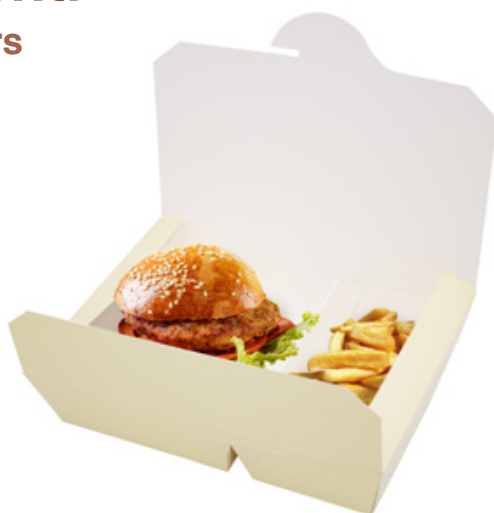
0310217 BOX ALIM. BISCOMP. CREMA dimensioni size 195x140h45 mm pz/conf pcs/pack 60 pz/cart pcs/box 240