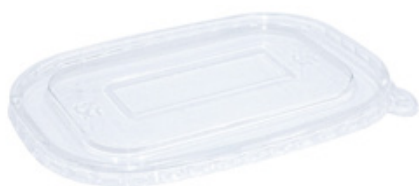
1BG184 COPERCHIO PET ANTIFOG PER 1BG180/1/2/3 pz/conf pcs/pack 50 pz/cart pcs/box 300