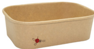
1BG181 PAPER BOWL R750 CERALACCA capacità capacity 750 ml dimensioni size 168x120h55 mm pz/conf pcs/pack 50 pz/cart pcs/box 300