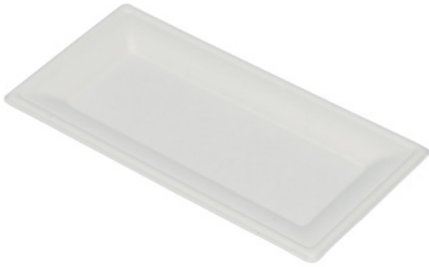
YDP037 VASSOIO RETTANGOLARE BIO-ECO dimensioni size 26x13 cm pz/conf pcs/pack 25 pz/cart pcs/box 500