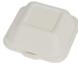
YDB024 CONTENITORE+COPERCHIO BIO-ECO dimensioni size 145x141 h47/75 mm capacità capacity 310 ml pz/conf pcs/pack 50 pz/cart pcs/box 500