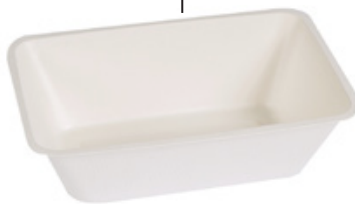
YDB064 VASCHEFFA BIO-ECO dimensioni size 203x136 h68 mm capacità capacity 1300 cc pz/conf pcs/pack 50 pz/cart pcs/box 600