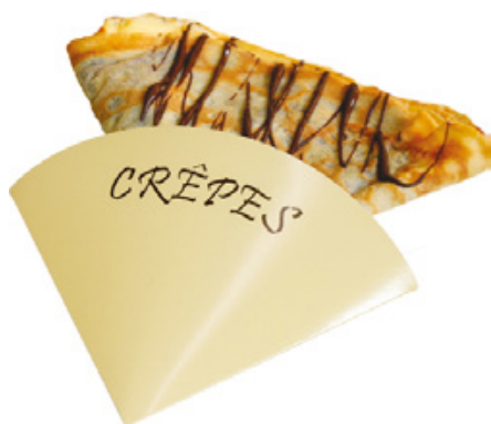
0310226 PORTA CRÊPES 1/4 CARTONCINO POLITENATO CREMA pz/conf pcs/pack 250 pz/cart pcs/box 500

Pure cellulose paper obtained matching white paper (inside) with kraft one (outside)