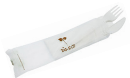
1VP316 BIS C-PLA 4 gr cad. + TOVAGLIOLO (forchetta/coltello/tovagliolo 2 veli) (fork/knife/napkin 2 layers) pz/conf pcs/pack 50 pz/cart pcs/box 250