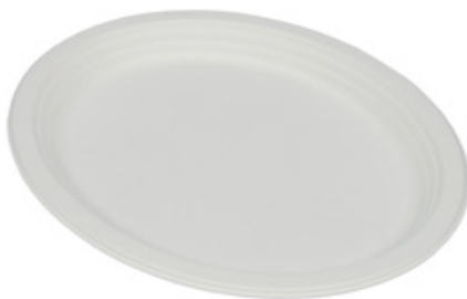
YDP020 VASSOIO OVALE BIO-ECO dimensioni size 26x20 cm pz/conf pcs/pack 25 pz/cart pcs/box 800