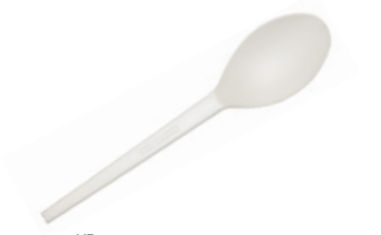
1VP225 CUCCHIAINO C-PLA dimensioni size 13 cm pz/conf pcs/pack 50 pz/cart pcs/box 1000