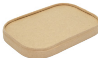
1BG185 COPERCHIO CARTA AVANA NEUTRO PER 1BG180/1/2/3 pz/conf pcs/pack 25 pz/cart pcs/box 300