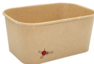
1BG183 PAPER BOWL R1000 CERALACCA capacità capacity 1000 ml dimensioni size 168x120h75 mm pz/conf pcs/pack 50 pz/cart pcs/box 300