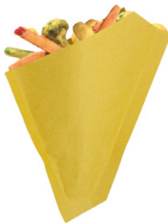
2TV099 CONO CARTA GIALLA GRANDE dimensioni size h240X215 mm pz/conf pcs/pack 300 pz/cart pcs/box 4200