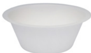
YDL015 COPPETTA BIO-ECO diametro diameter 11,5 cm capacità capacity 250 cc pz/conf pcs/pack 50 pz/cart pcs/box 1500