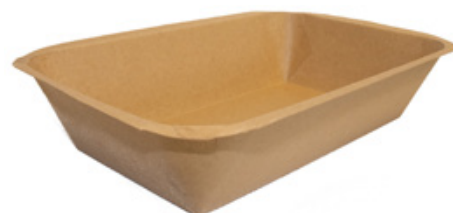
MT3 VASSOIO CA+PE AVANA KRAFT 800 ml dimensioni size 209x139h43 mm pz/conf pcs/pack 100 pz/cart pcs/box 600