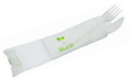
1VP216 BIS C-PLA 5 gr cad. + TOVAGLIOLO (forchetta/coltello/tovagliolo) (fork/knife/napkin) pz/cart pcs/box 250