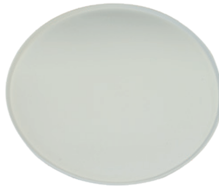
YDP033 PIATTO PIZZA BIO-ECO diametro diameter 33 cm pz/conf pcs/pack 25 pz/cart pcs/box 500