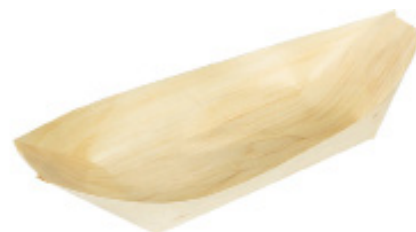
GW3018 BARCETTA PALMA dimensioni size 220x115 mm pz/conf pcs/pack 50 pz/cart pcs/box 1000