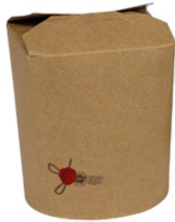
1BG080 TAKE AWAY BOX AVANA 500cc capacità capacity 500 cc pz/conf pcs/pack 50 pz/cart pcs/box 500