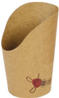
0310260 COPPA P/PATATINE AVANA PICCOLO capacità capacity 8 oz dimensioni size Ø60 h67/115 mm pz/conf pcs/pack 50 pz/cart pcs/box 1000