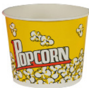
1BG062 CONTENITORE POP CORN LARGE capacità capacity 64oz / 1900ml pz/conf pcs/pack 50 pz/cart pcs/box 300