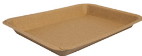
MT2 VASSOIO CA+PE AVANA KRAFT 520 ml dimensioni size 203x163h22 mm pz/conf pcs/pack 100 pz/cart pcs/box 600