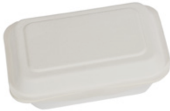
YDB001 CONTENITORE+COPERCHIO BIO-ECO dimensioni size 191x136 h44/59 mm capacità capacity 500 ml pz/conf pcs/pack 25 pz/cart pcs/box 500