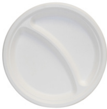
YDP038 PIATTO BIS BIO-ECO diametro diameter 22 cm pz/conf pcs/pack 25 pz/cart pcs/box 500