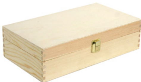
502352 CASSETTA CHIUSA 2 BOTTIGLIE PINO NATURALE dimensioni size 35x19 h9 cm pz/cart pcs/box 12