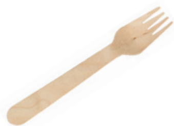
GW2404 FORCHETTA LEGNO dimensioni size 16 cm pz/conf pcs/pack 100 pz/cart pcs/box 2000