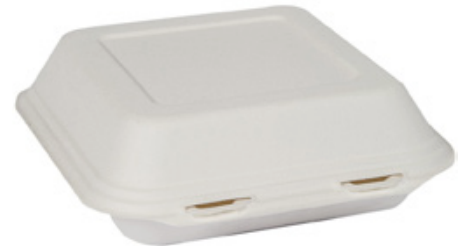
YDB026 CONTENITORE+COPERCHIO BIO-ECO dimensioni size 218x207 h40/64 mm capacità capacity 700 ml pz/conf pcs/pack 50 pz/cart pcs/box 250