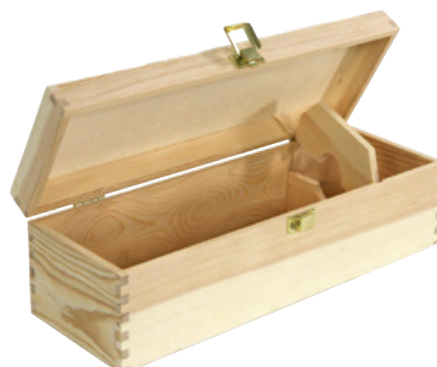
502351 CASSETTA PINO NAT. CHIUSA 1 CHAMPAGNE dimensioni size 38x13 h12 cm pz/cart pcs/box 20