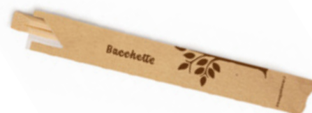
GWB2518A BACCHETTE BAMBOO INCARTATE dimensioni size 210x4,8 mm pz/conf pcs/pack 100 pz/cart pcs/box 2000